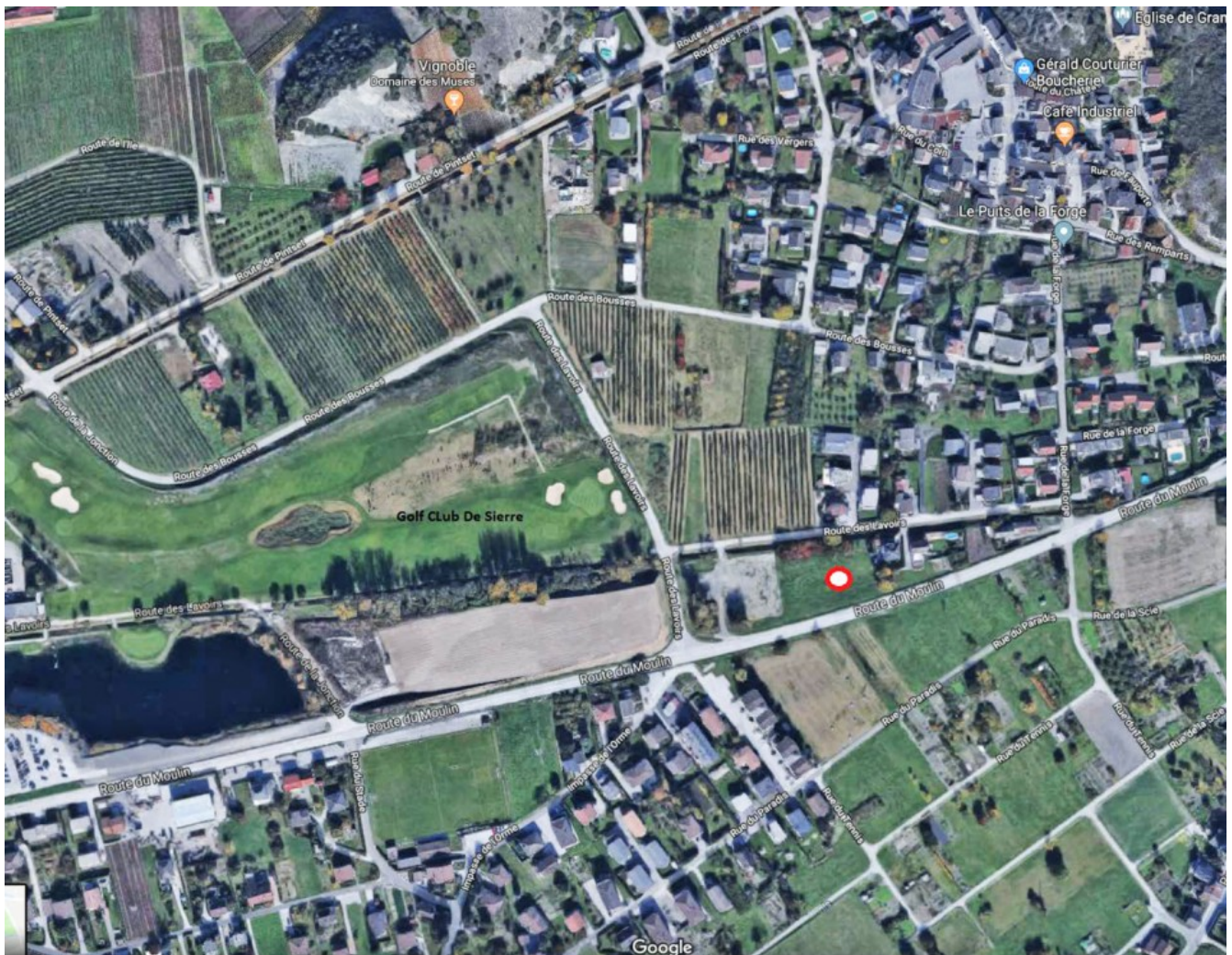
Route des Lavoirs - 3977 Granges/Sierre